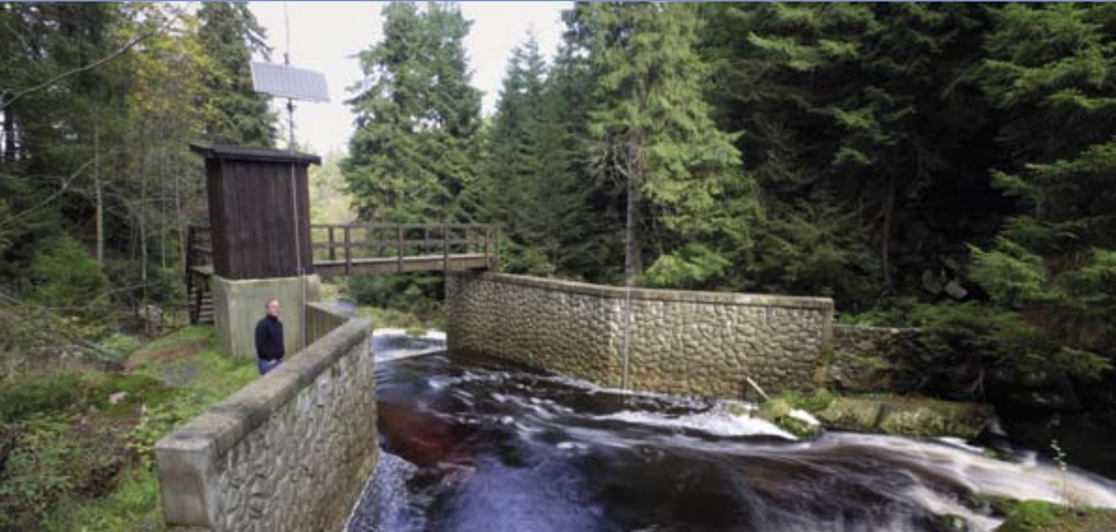
Pegel Gitterkopf im Zulauf zur Eckertalsperre.

Sie brauchen ein wasserwirtschaftliches Monitoringsystem, maßgeschneidert auf Ihren Anwendungsfall? Die Harzwasserwerke GmbH ist dafür der richtige Ansprechpartner. Unser Leistungsangebot umfasst sowohl die Planung und Installation der Messgeräte als auch das Einrichten der Datenfernübertragungstechnik und der Visualisierungssoftware. Auf Wunsch bieten wir auch die Auswertung von Daten an.